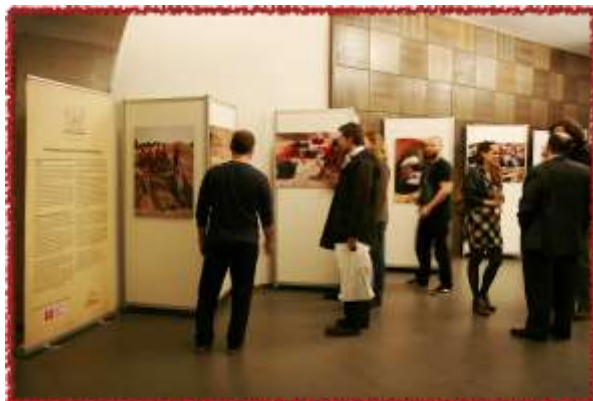
Výpravy do starovekého Egypta 2017 a fotovýstava