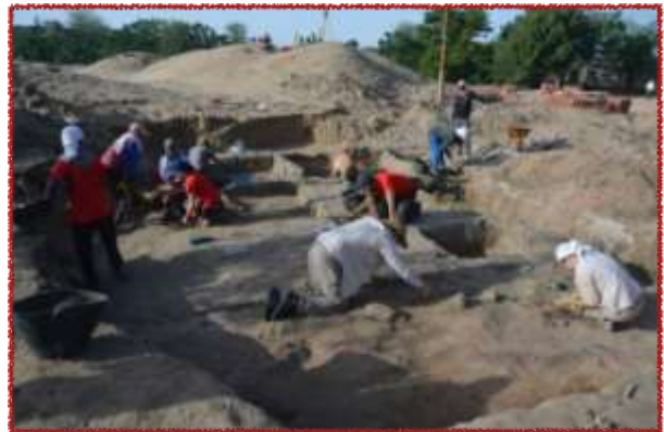
Výskum na Tell el-Retábí