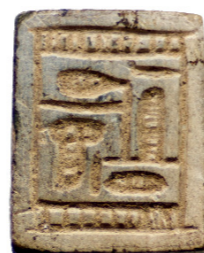
Vyrezávaný korálik z Tell el-Retábí

Údaje o prijímateľovi: IČO/SID: 00681067 Právna forma: Subjekt výskumu a vývoja Názov: Ústav orientalistiky SAV Ulica: Klemensova 19 PSČ: 813 64 Obec: Bratislava