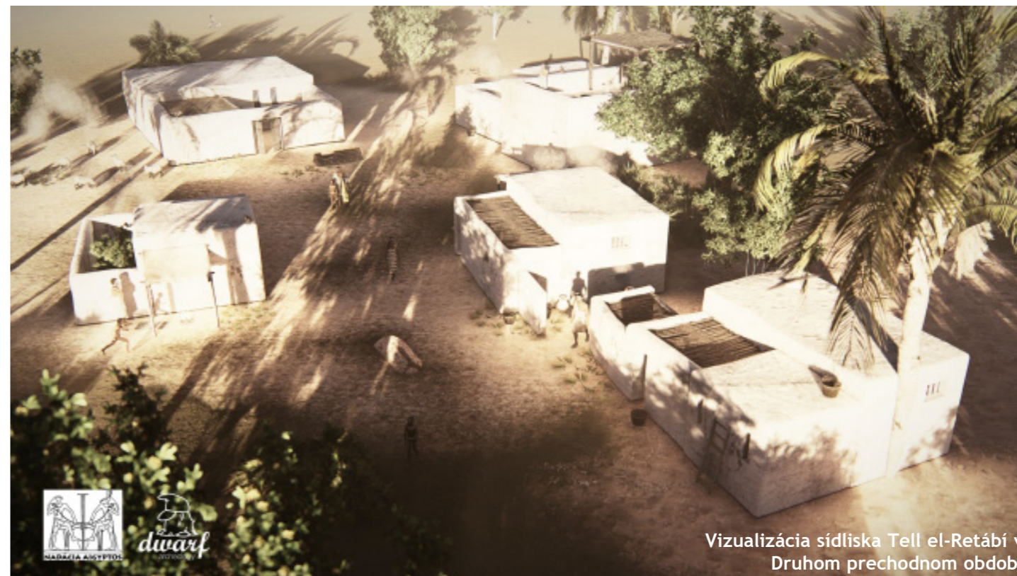
Vizualizácia sídliska Tell el-Retábí v Druhom prechodnom období

Na našom YouTube kanáli sa obe verzie, slovenská i anglická, tešia záujmu verejnosti – zatiaľ boli zhladnuté asi 16 000 krát. Vizualizácia bola pochvalne prijatá nielen doma, ale aj v zahraničí, medzinárodnou odbornou i laickou verejnosťou. Pohľady na vizualizáciu v našom newsletteri vidíte na titulke i na str. 3.