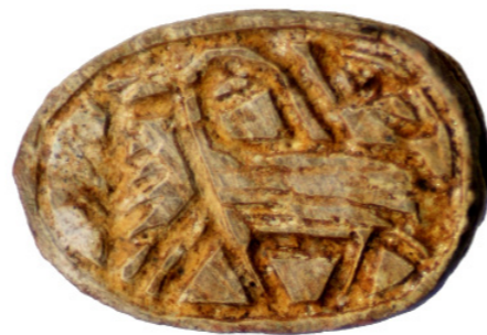
Skarabeus z hrobu dospelého muža v Tell el-Retábí Druhé prechodné obdobia

Z doby Novej ríše (15.-12. stor. pr. Kr.) pochádzajú zvyšky zásobovacej cesty, ktorá slúžila pri rozširovaní pevnosti za vlády panovníka Ramesseho III z 20. dynastie.