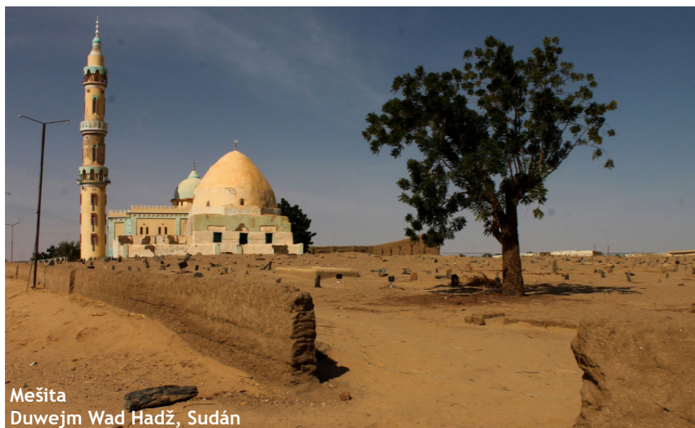
Mešita Duwejm Wad Hadž, Sudán