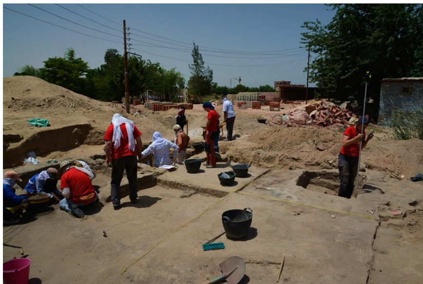
Terénny výskum 2016

Podpora archeologického výskumu na lokalite Tell el-Retábí vo Wádí Tumuláte, v severovýchodnej nílskej delte, Nadáciou Aigyptos významne prispieva k realizácii primárneho egyptologického výskumu zo strany slovenských vedcov. Okrem priamej podpory výskumu Nadácia Aigyptos významnou mierou prispieva aj k podpore egyptologickej publikačnej činnosti a k udržiavaniu a rozvoju spolupráce s egyptologickými inštitúciami v zahraničí. Na zabezpečenie 9. výskumnej sezóny v Egypte, (1. - 31. mája 2016) nadácia priamo vynaložila 130,00 € zo získaných prostriedkov. Na financovaní výskumu sa podieľali aj Agentúra na podporu výskumu a vývoja (grant APVV-5970-12) a Vedecká grantová agentúra (grant VEGA 2/0139/14).