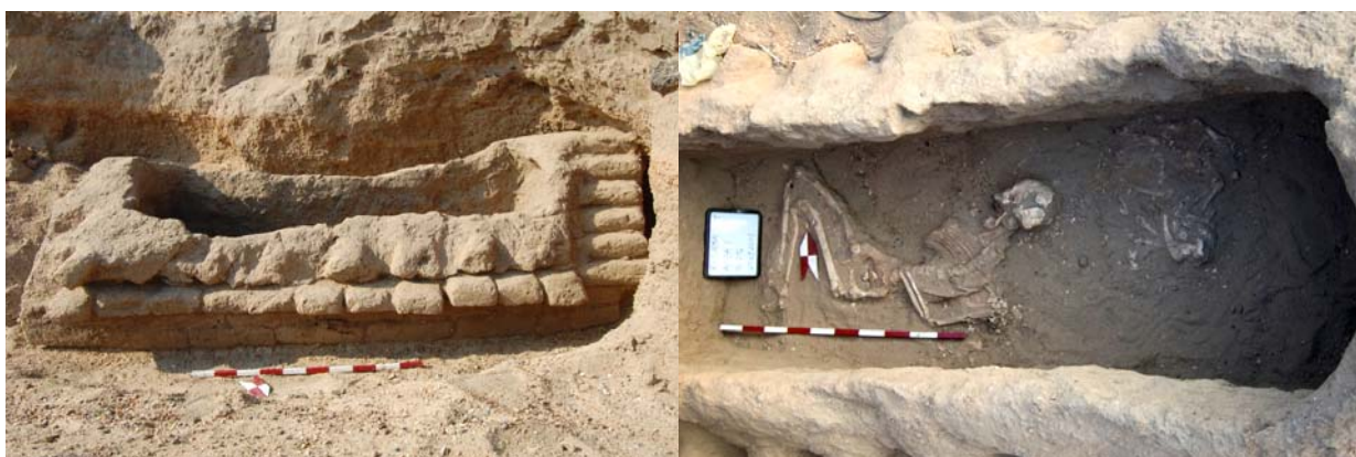
Obr. 2 Jeden z hyksóskych hrobov, objavený v roku 2011