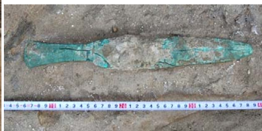
Obr. 4 Bronzová dýka nájdená v tzv. Čiernom dome.