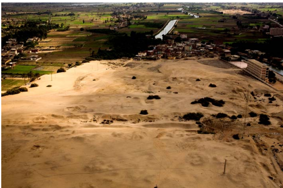
Obr. 1 Pohľad na lokalitu Tell el-Retábí z vtáčej perspektívy