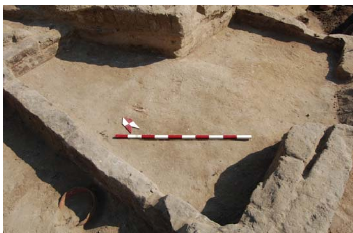
Obr. 3 Pôdorys tzv. Čierneho domu z obdobia 18. dynastie