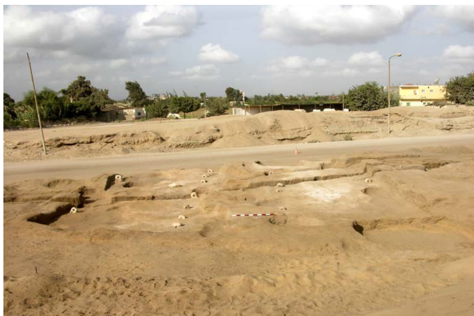
Obr. 6 Pozostatky stajní z Tretieho prechodného obdobia s kamennými blokmi na priväzovanie zvierat